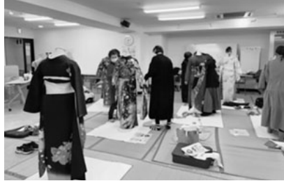
写真は上からアップコース、カットコース、着付け各コースの前回受講風景

▽受講料 2万5000円(全6回) ▽定員 15名 ▽日程 9月13日・10月11日・11月1日・29日・12月20日・5年2月7日