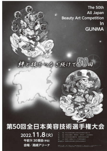
第50回全国大会の告知ポスター

KBKでは、11月8日(火)に群馬・高崎アリーナで開催される3年ぶりの全国大会に、1泊2日の応援バスツアーを企画。全国大会は50回の節目