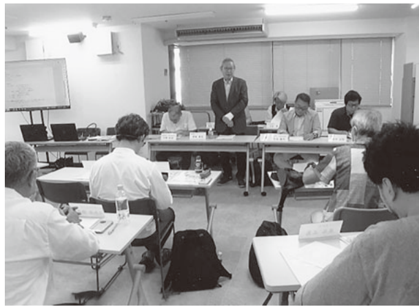
各議案を審議するKBK理事会