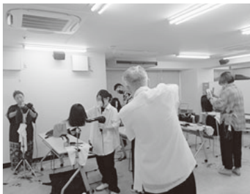
カットコース9月5日第1回