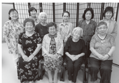
あかね会懇親会の参加者

梅雨の晴れ間の6月19日、恒例のあかね会総会が箱根湯本の富士屋ホテルで開催されました。