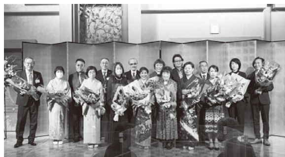
各種被表彰者に花束

のあと、永年勤続従業員4名(うち1名欠席/代理)が表彰されました。また各種被表彰者17名