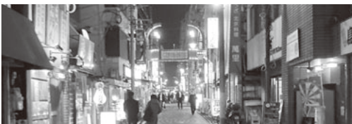
野毛小路の新旧のお店

美容で言えば、これは支部での活動にも共通するものがあるのではないのでしょうか。同業でありながら情報交換、助け合い、学び、楽しみを共有しています。美容が盛んな街を県でも生み出せたら良いなと思いました。