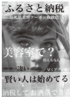
ふるさと納税新ポスター

「目指せ客単価1万円」をスローガンにしているKBKでは、このほど組合員サロンに対して経営形態、美容料金についてのアンケート調査を実施しました。現在集計中。これについてKBKでは次のようにのべています。「昨今、公共料金(電気・ガス・水道)の値上げは著しく、他の分野での物価高騰も止まることありません。政府や大企業では大幅な賃上げが叫ばれています。しかし美容業においては、はほど遠い話であり、このままでは美容業の衰退は火を見るより明らかです。この問題の解決には10年以上改定が行われていないという美容料金の改定が必要条件です。組合では「目指せ客単価1万円」をスローガンとし、適正料金の基準作りを行い、健全で安定的な経営を目指したいと考えています」