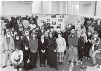
鳥海講師と受講の皆さん