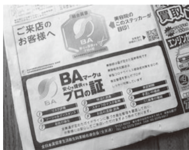
全美連の一般紙広告

全美連では「消費者に対する組合員店舗の安全性をPR」する広告を、11月10日付読売新聞朝刊に掲載しました。サイズは5段2分の1。