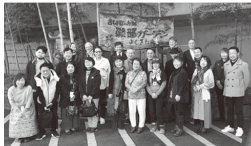
応援ツアーで笑顔の皆さん

応援ツアーに行つて来ました。全国大会応援ツアーに行つて来ました。2日間共にとても良いお天気で空もツアーを応援しているように感じました。途中渋滞にはまり残念