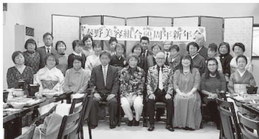
出席者で記念撮影

浜中華街の福龍酒家にて納会を開催いたしました。美しい中華料理とおいしいお酒で皆さんは盛り上がりました。2次会のカラオケでも楽しい時間を過ごせ、よい年の納めになりました。 午年は明るく活発、行動力と社交性に富みポジティブな年に、丙午で大きな飛躍や挑戦、成功が期待される縁起の良い年になると言われています。ますます組合が発展するよう祈念いたします。