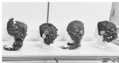
アップスタイルコースの作品

これから新しい時代にふさわしい活動を重ね、次の時代へとつないでいきたいと思っています。