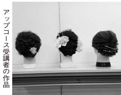
アップコース受講者の作品