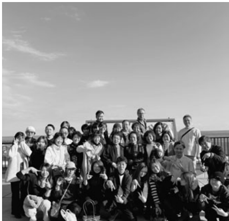
参加者で記念撮影