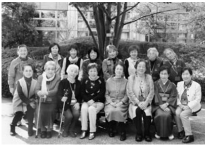
あかね会の皆さん