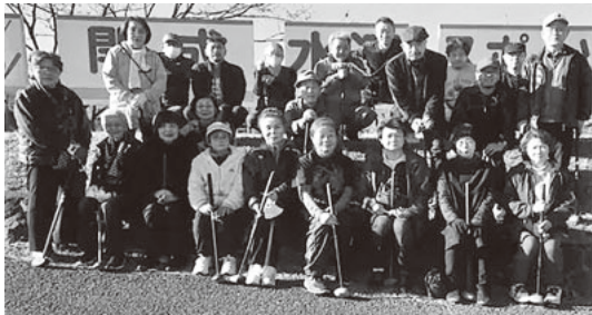
参加した理美容組合の方々