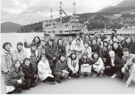
芦ノ湖畔で記念撮影