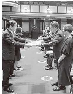
令和5年度神奈川県民功労者にKKK副理事長