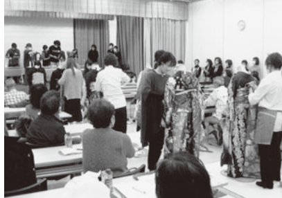
④カットとアップ仕上げ ⑤着付けの仕上げ

アカデミー発表と修了証授与 昨年9月に開講したK BKビューティーアカデミー(白水秀毅校長)の受講生発表会と受講修了