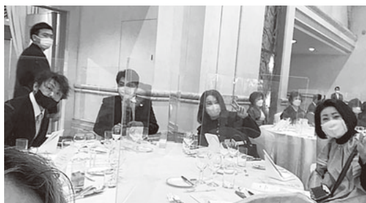
賀詞交歓会に参加

らいで、明るい兆しとなってきているのではないのでしょうか。これからの私たちの活動に繋げて行きたいと感じています。