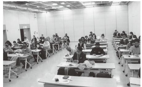
令和4年度第2回支部長会

席した各コースの指導員が経過を報告。そのあと白水校長から受講生ひとり一人に受講修了証が授与され、会場から盛んに拍手を浴びました。