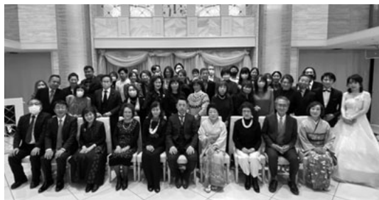
着飾って新年会に参加