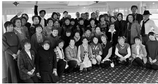
新年会参加の皆さん

1月17日(火)。趣向を変え「都内散策とサンセットシンフォニークルーズ」日帰りバスツアー。溝の口を9時に川崎を10時に出発しまず浅草へ。仲見世通りを抜け浅草寺をお詣りし、自由に食事や買い物。浅草寺は初めてで寒い日にも関わらず沢山の観光客。外国人観