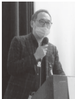
支部長会で賦課金の徴収方法について積極的に意見をのべる支部長の皆さん